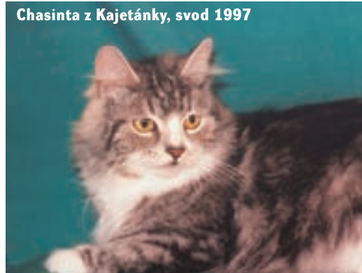
Chasinta z Kajetánky, svod 1997